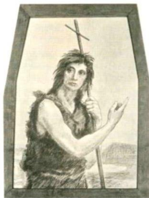
Johannes der Täufer