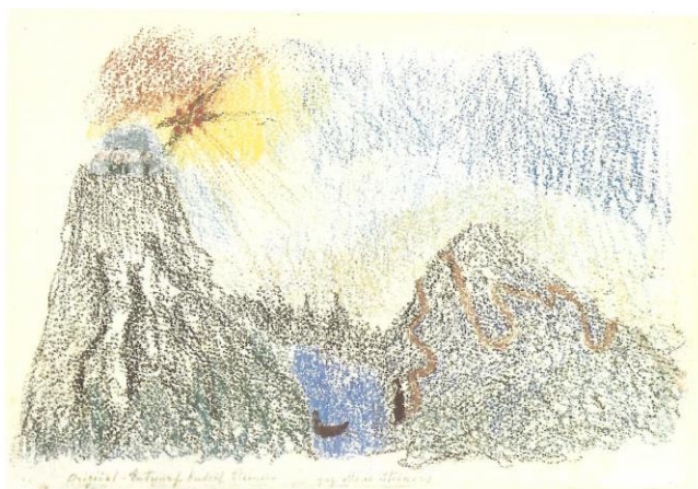
Mysteriendramen-Bühnenvorhang, Entwurf: Rudolf Steiner 1914