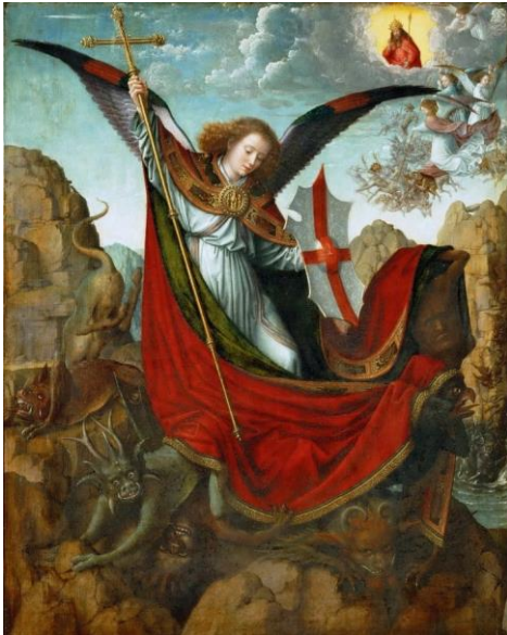
Gerard David, Erzengel Michael um 1500, 1510 – Kunsthistorisches Museum Wien