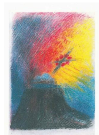
Pastellskizze: Christian Hitsch